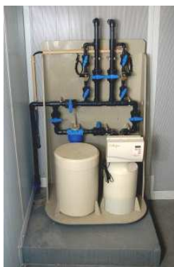
Suporte para descalcificador em polipropileno

Fabricamos os mais diversos produtos por medida/desenho em polietileno ou polipropileno, eis alguns exemplos: