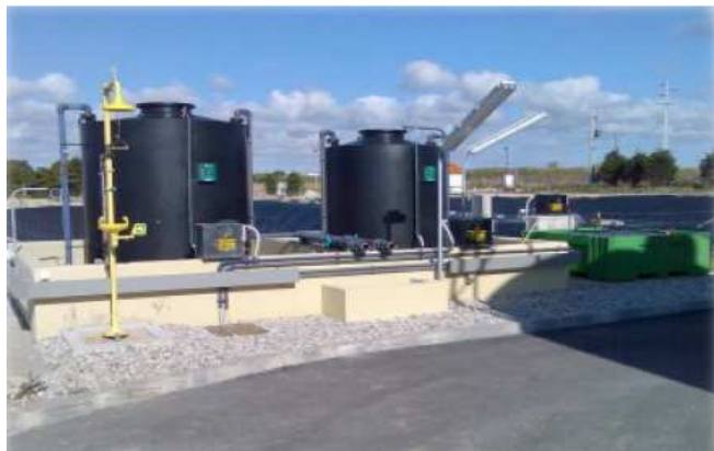
Depósitos de armazenagem em retenção clássica de betão: possibilidade de acessórios laterais sem restrições.

Com ou sem cuba de retenção até 50.000 litros de capacidade.