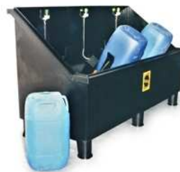
Tina para lavagem de bilhas