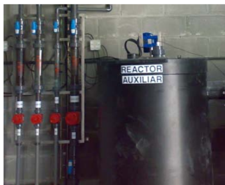
Reactor/depósito de mistura em PEAD