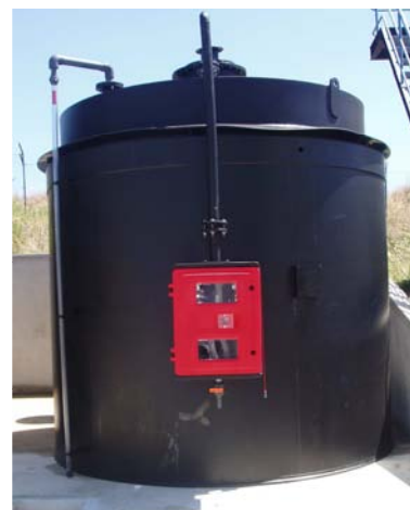
Depósito com cuba de retenção (ETA do Enxoé): construção civil simplificada, menor espaço ocupado. Ausência de acessórios laterais. Obrigatório a aspiração de produto por picagem superior. Na foto armário de carga em PEAD