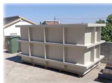
Cuba para banho de galvanoplastia